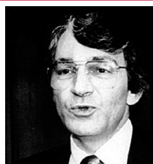
Dieter Schwarz Gründer von Lidl Mitarbeitern, die sich privat treffen, droht die Kündigung. Kassen werden heimlich videoüberwacht. In Tschechien waren Toilettengänge zur Arbeitszeit verboten. Frauen duften dort nur dann außerhalb der Pausen aufs Klo, wenn sie mittels eines Stirbundes weithin verkündeten, dass sie ihre Tage haben.