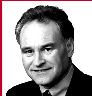
Erwin Huber Bundesratsminister Bayerns Huber brachte in das neue Telekommunikationsgesetz erfolgreich die Forderung ein, dass mit dem Verkauf einer Prepaid-Karte auch die persönlichen Daten des Käufers erfasst werden müssen. So gibt es keine Möglichkeit mehr, anonym ein Mobiltelefon zu besitzen und mit ihm zu telefonieren.