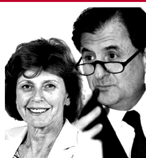
Janelly und Jean-Rene Fourtou EU-Abgeordnete und Universal-Chef Die französische Parlamentarierin bewirkte federführend die EU-Richtlinie zur massiven Verfolgung privater Internetnutzer, denen Urheberrechtsdelikte vorgeworfen werden. Dies kommt dem Chef des Musikgiganten Universal, ihrem Mann, sehr gelegen. Niveauvolle Lobbyarbeit.