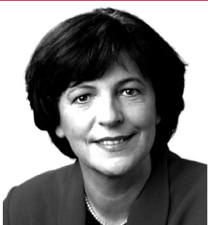
Ulla Schmidt Bundesgesundheitsministerin Die Gesundheitskarte kommt 2006, das ist beschlossen. Nicht klar ist, welche Funktionen sie hat, welche persönlichen Daten auf ihr und in Datenbanken abgespeichert werden und wer Zugriff auf sie hat. Hier droht nicht nur ein weiteres Instrument eines Überwachungsstaates, sondern auch ein zweites Toll Collect.

Im Zusammenhang mit geltendem Landes-, Bundes- und Menschenrecht weisen Datenschützer auf folgende Personen hin: